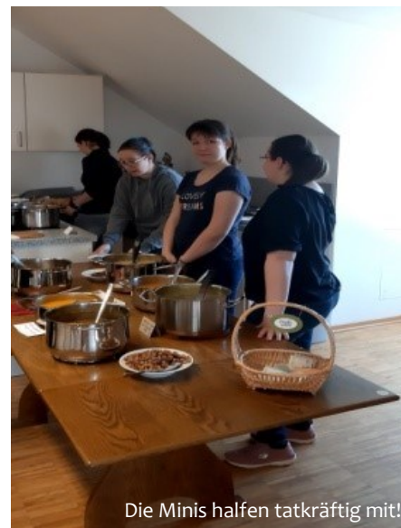
Die Minis halfen tatkräftig mit!

Wenn auch Sie sich für den freiwilligen Einsatz unserer Minis erkenntlich zeigen und ihren Ausflug unterstützen möchten, können Sie dies gerne unter folgender Bankverbindung tun: Kirchenverwaltung Schwifting VR-Bank Landsberg-Ammersee eG DE24 7009 1600 0005 8129 50 Kennwort: Ausflug Ministranten