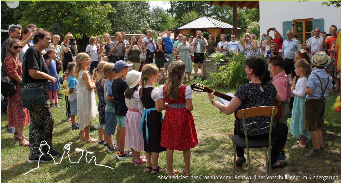
Abschiedsfest der Grashüpfer mit Rauswurf der Vorschulkinder im Kindergarten