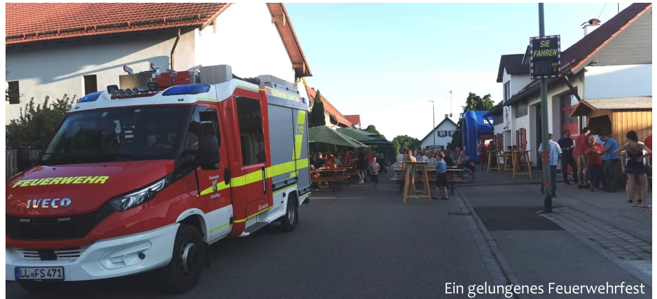
Ein gelungenes Feuerwehrfest